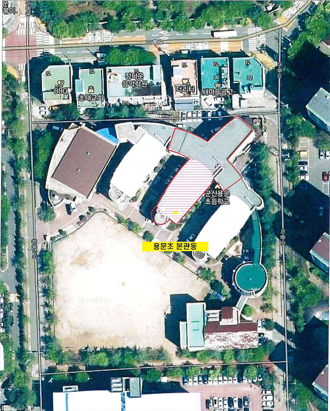
측정 건물 위치도