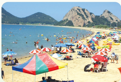
☉ 출·복항 승선요금(쾌속선)