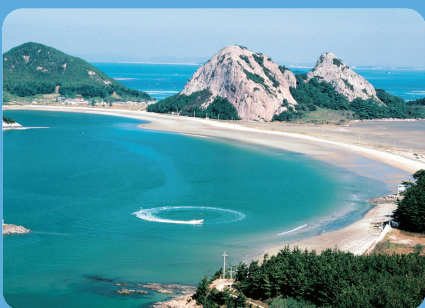
투명하고 깨끗한 명사십리 해수욕장