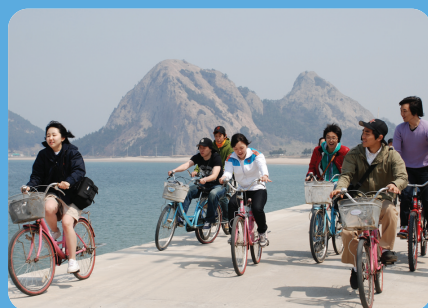
바람을 가르는 자전거 하이킹