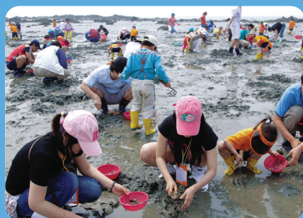
온가족이 함께 하는 갯벌체험