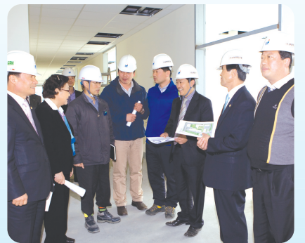
〈경제건설위원회〉 융복합플라즈마연구센터 현장

현장방문으로 행정복지위원회는 예술의 전당, 청소년지원센터, 건강가정·다문화 가족지원센터, 오토캠핑장 조성사업장, 새만금주변 공원조성사업장 등 5개소를, 또 경제건설위원회도 미장지구 도시개발사업지, 새만금종합비즈니스센터 신축 현장, 융복합플라즈마연구센터 신축현장, 자연재해위험지구, 산북동 하나리움 아파트 공사현장, 해망동 보금자리주택 건립예정지, 전통시장 현대화사업 신축 현장 등 7개소를 둘러봤다.