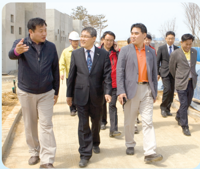
〈행정복지위원회〉 오토캠핑장 조성사업장

군산시의회가 지난 16일부터 5일간 제157회 임시회를 갖고, 현장중심의 적극적인 의정활동을 펼쳤다.