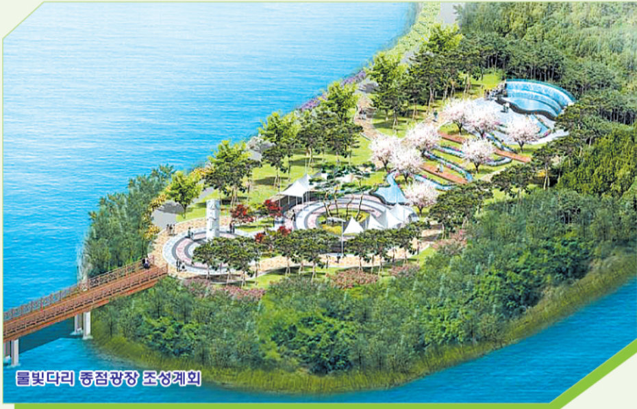
물빛다리 종점광장 조성계획

군산 은파관광지가 자연주변경관과 조화를 이룰 수 있는 가족 중심의 휴식공간으로 변모하고 있다.