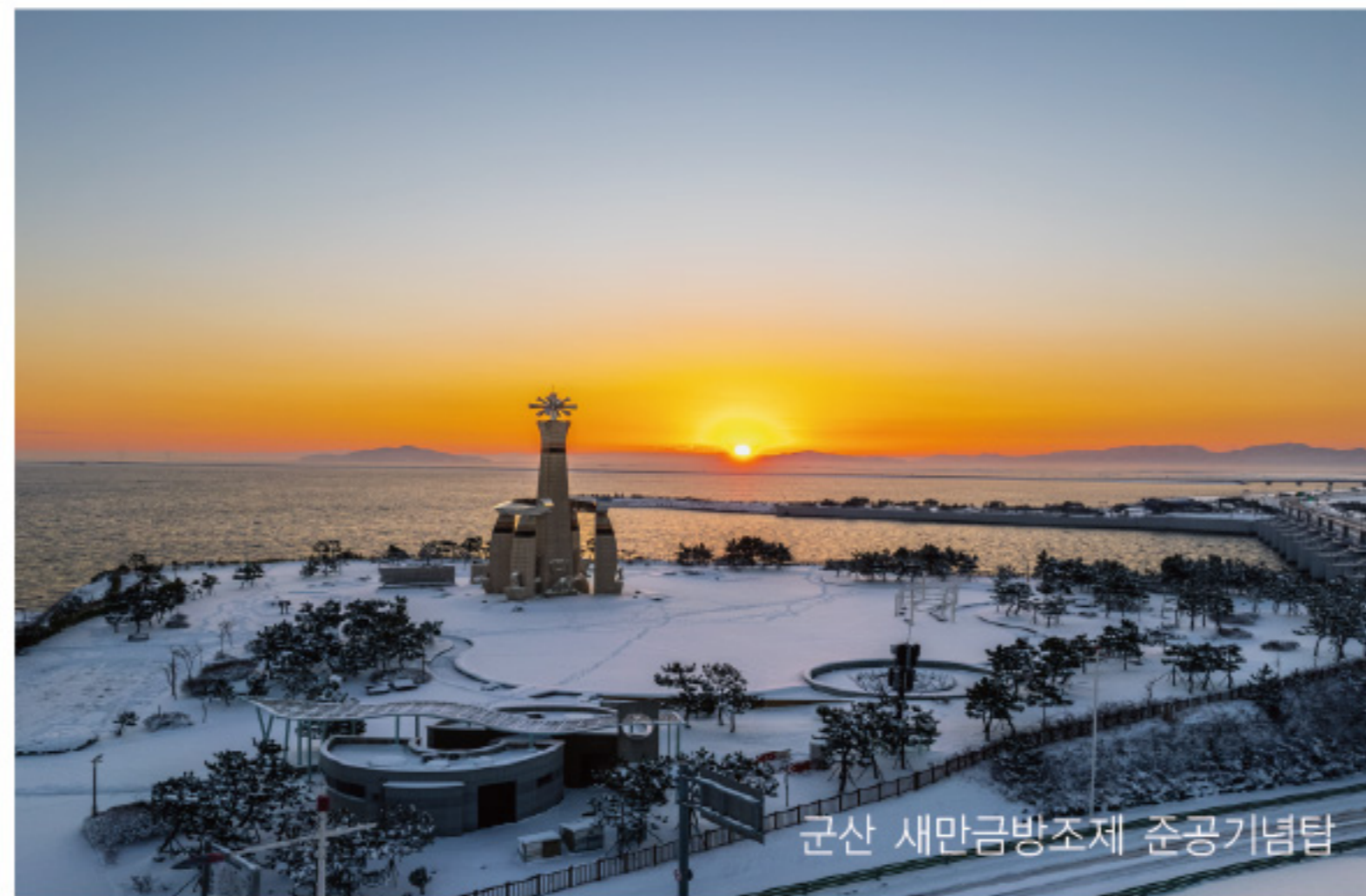
군산 새만금방조제 준공기념탑