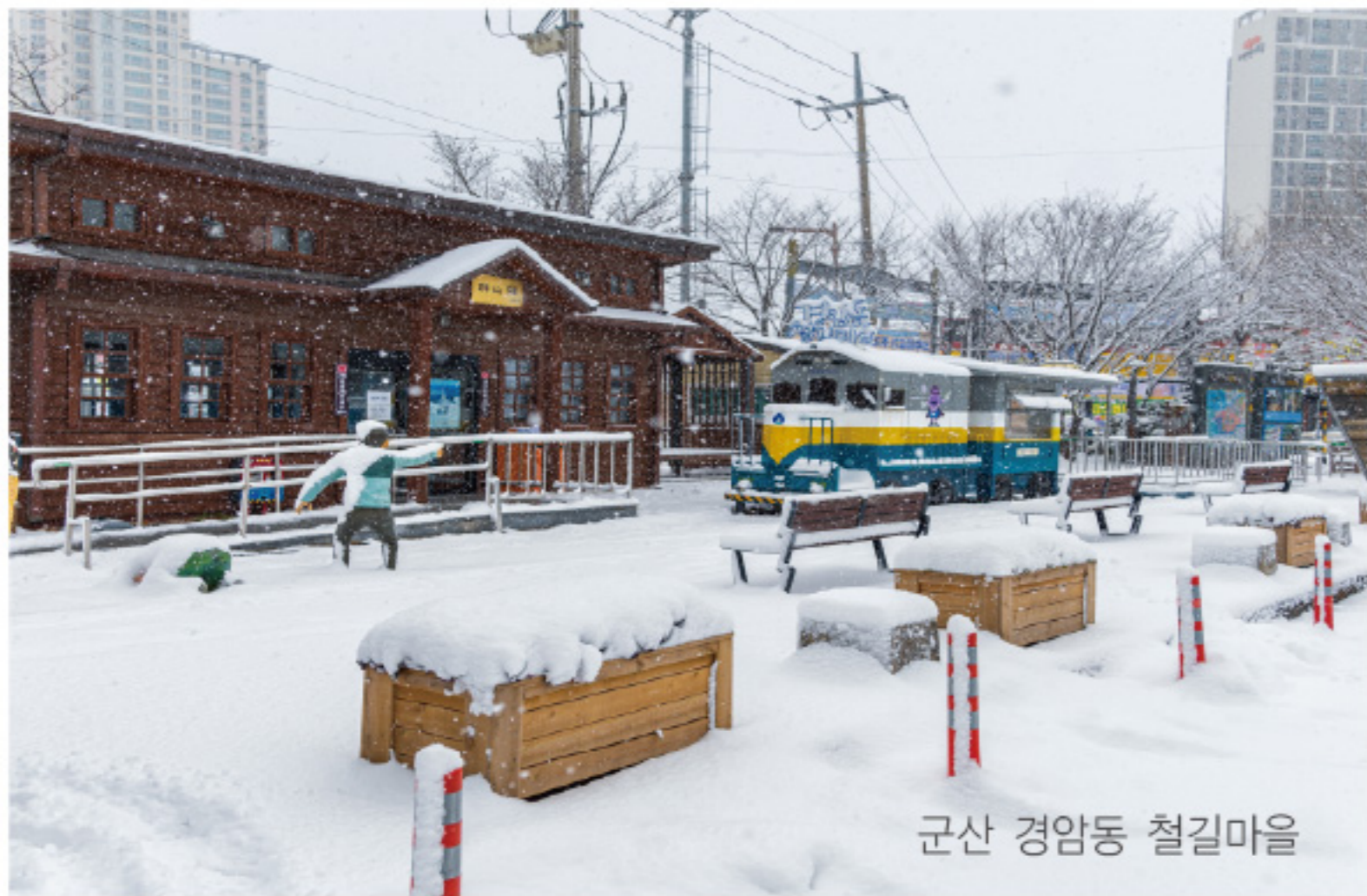
군산 경암동 철길마을