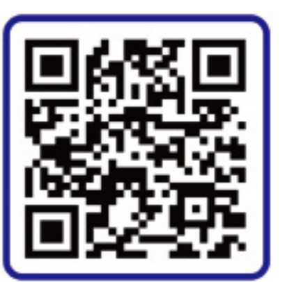
군산시 공식 SNS 링크 바로가기

유튜브 https://www.youtube.com/@gunsansi 블로그 http://blog.naver.com/gunsanpr 페이스북 https://www.facebook.com/gunsancity1 인스타그램 https://www.instagram.com/gunsan_official 카카오채널 http://pf.kakao.com/_uxaxdjT 홈페이지 http://www.gunsan.go.kr