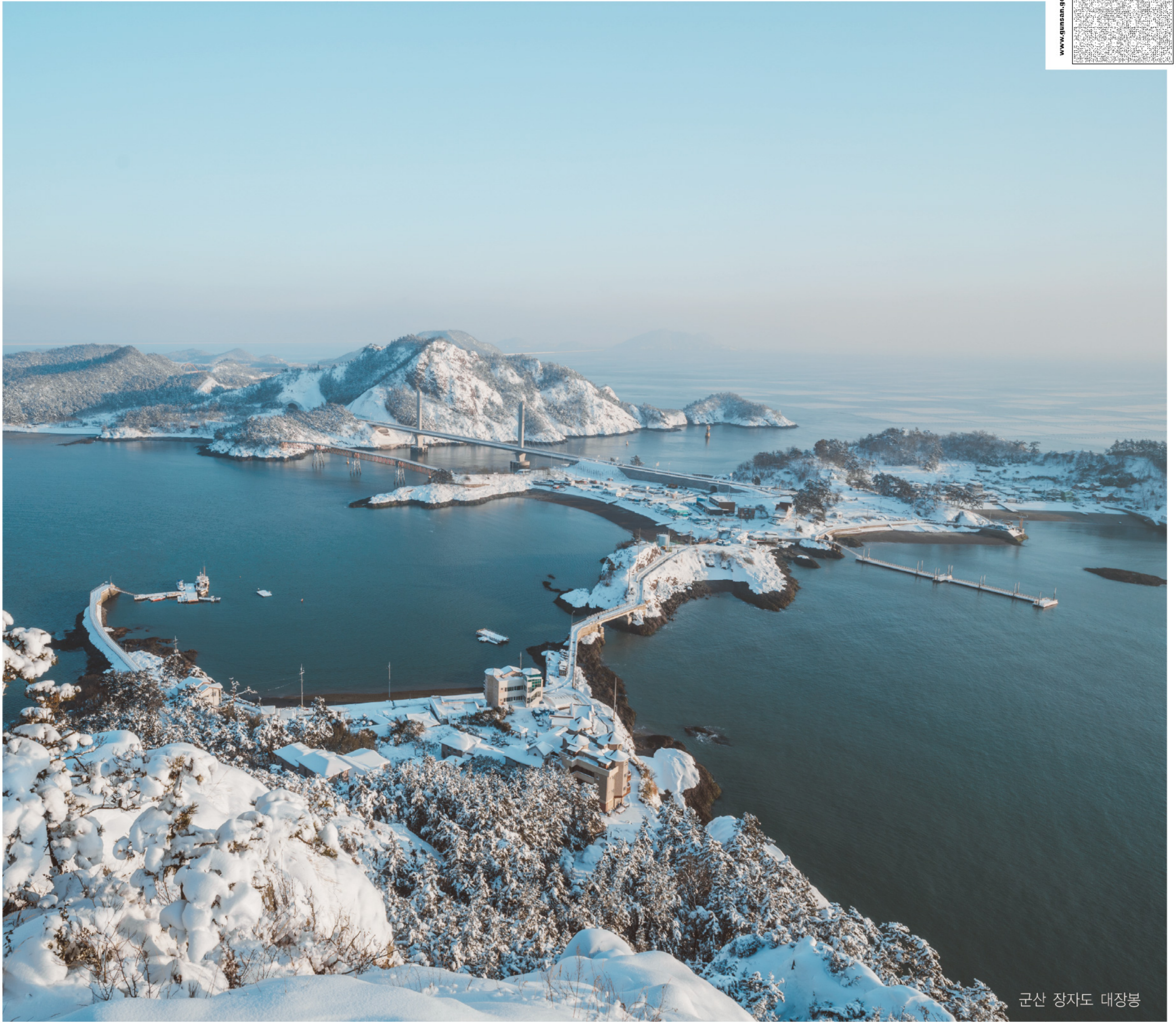
군산 장자도 대장봉