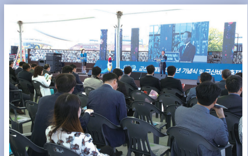
군산개항 120주년 기념식 및 군산바다축제