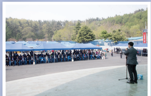
제97회 어린이날 기념식