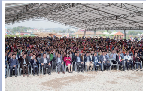
제14회 군산 콩당보리축제 개막식