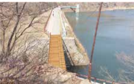
록 주요지점에 안내 표지판 및 시설물을 설치하여 시민들의 불편이 최소화 될 수 있도록 할 예정이며 시민들의 적극적인 협조가 필요하다. 수도과 454-5412

시민들의 통행에 불편을 끼쳐왔기 때문에 군산시는 오는 7월 중순부터 9월 초까지 현재 사용 중인 월명호수 공도교를 철거하고 자연과 어우러지는 친환경적 경관으로 조성하여 월명공원을 산책하는 시민들의 편의를 증진하고 제방시설물의 안전성을 확보할 계획이다. 공도교의 개설공사가 안전하고 원활히 이루어 질 수 있도록