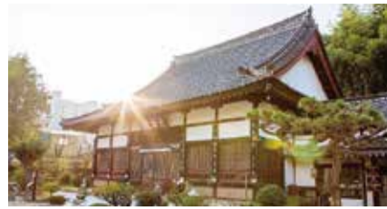
대로 오는 10월 중 사업을 착공하고 2018년 하반기에 완료될 예정이다. 도시재생과 454-3543

통해 1층과 2층에는 주차면수 50대 규모의 주차장이, 3층에는 근대문화 체험공간과 편의시설이 들어서면 주차문제를 해소하고 근대문화도시 관광활성화와 지역경제 활성화에 도움을 줄 것으로 기대된다. 이 사업은 기본 및 실시설계 용역이 마무리 되는