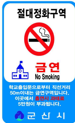
다. 절대정화구역 금연구역