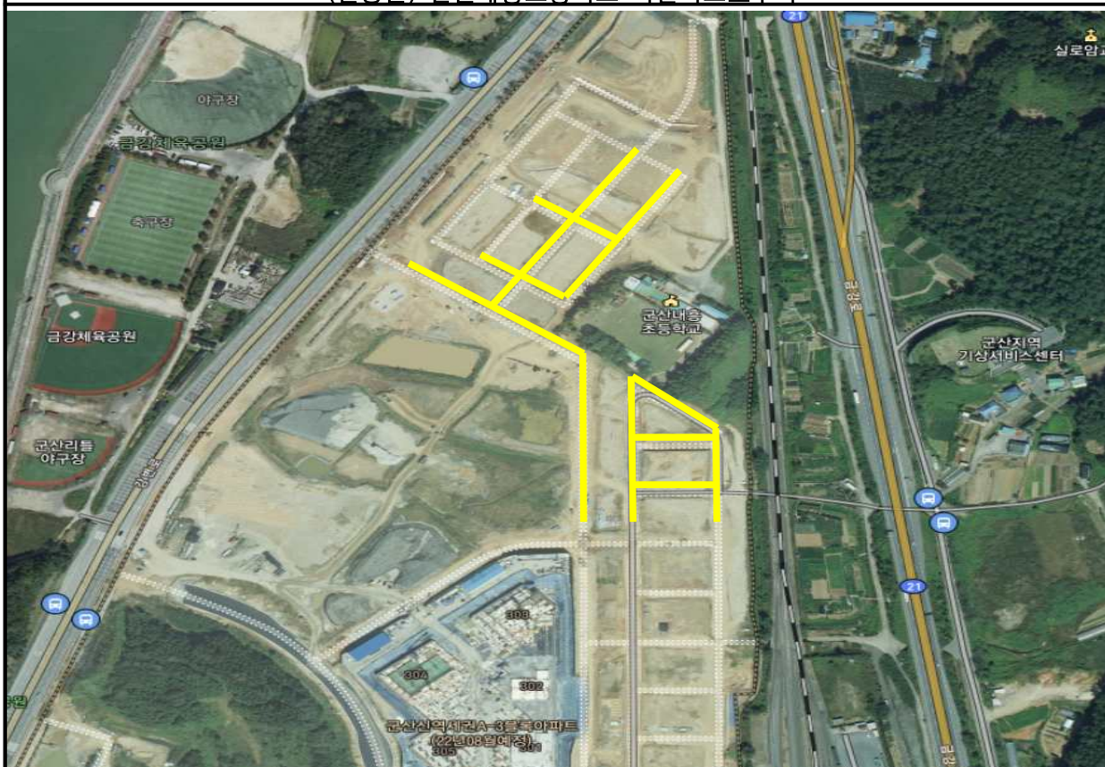
(변경후) 군산내흥초등학교 어린이보호구역