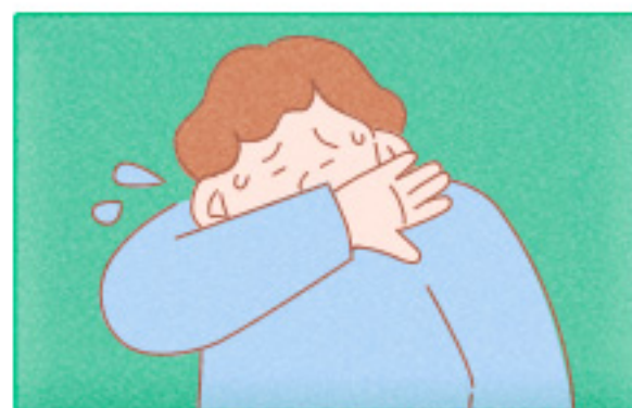
기침할 땐 옷소매로 가리기