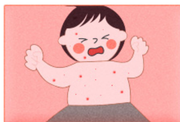
좁쌀 모양 발진