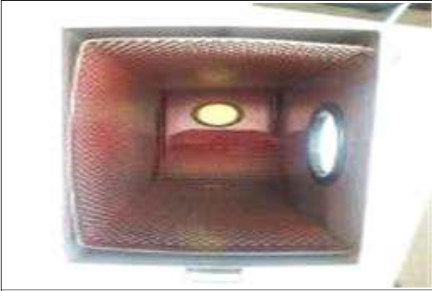
○ 회수부 내 거름망 일부 절단