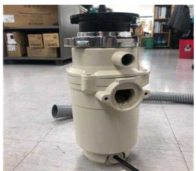
○ 분쇄기와 2차측(미생물액상발효소멸조)의 연결부를 단순자바라 호수로 쓰는 경우 - 일반 자바라 호수를 사용하여 설치