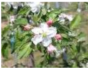
(나) 사과꽃이 10% 개화