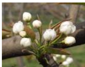
(가) 배 풍선기

* 배 : 꽃이 과수원의 50% 수준으로 핀 날에 방제(그림의 (나)와 (다)의 사이에)