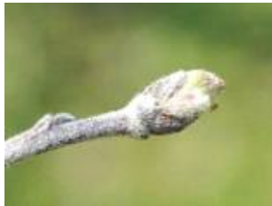
(나) 사과 발아기