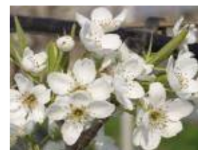
(다) 배꽃이 80% 개화