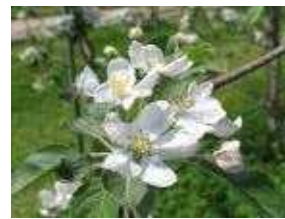
(다) 사과꽃이 80% 개화