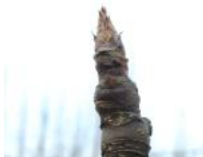
(가) 배 휴면기

* 약제살포 적기(배) : 꽃눈 발아 직후(그림의 (나)와 (다)가 함께 보일 때)