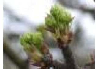
(라) 배 전엽기

- 2회차 : 꽃이 과수원의 50% 수준으로 핀 날 (4월 중순~5월 초순)