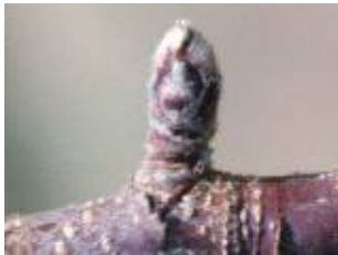
(가) 사과 휴면기

* 약제살포 적기(사과) : 녹색기~전엽기(그림의 (다)와 (라)가 함께 보일 때)