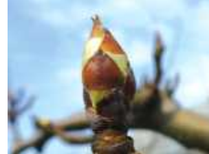
(나) 배 발아기