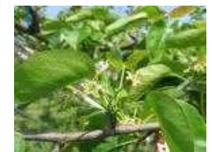
(라) 배 낙화기