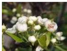
(나) 배꽃이 10% 개화