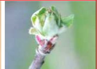
(라) 사과 전엽기

* 약제살포 적기(배) : 꽃눈 발아 직후(그림의 (나)와 (다)가 함께 보일 때)