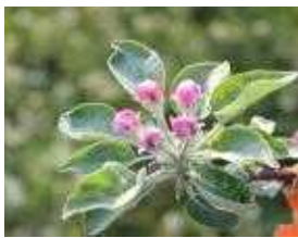
(가) 사과 풍선기

* 사과 : 꽃이 과수원의 50% 수준으로 핀 날에 방제(그림의 (나)와 (다)의 사이에)