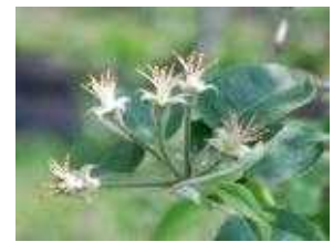
(라) 사과 낙화기

* 배 : 꽃이 과수원의 50% 수준으로 핀 날에 방제(그림의 (나)와 (다)의 사이에)