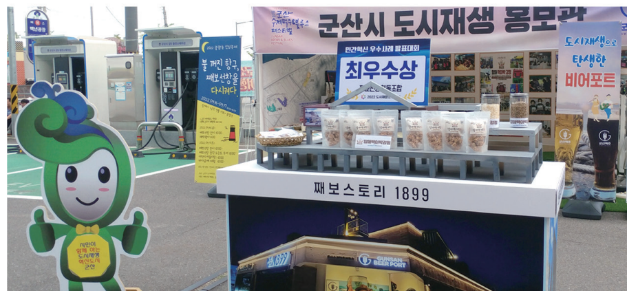
2022 군산 수제맥주&블루스 페스티벌