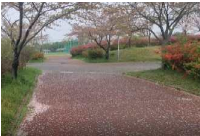
<광장 및 휴게시설>