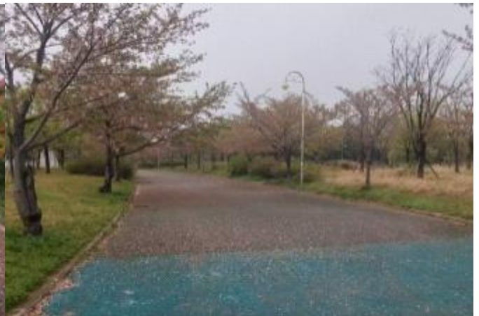
<광장 및 휴게시설2>