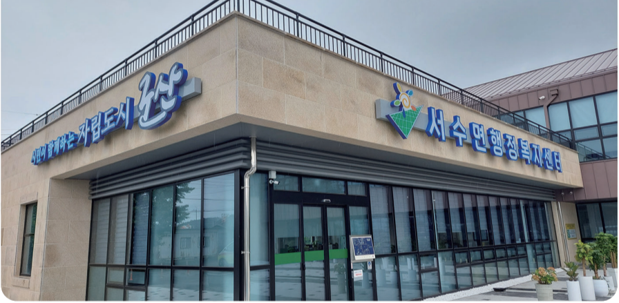
27개 읍면동, 청사 명칭 일원화로 혼란 방지

읍·면사무소, 주민센터, 행정복지센터 등으로 불려왔던 27개 읍·면·동사무소의 명칭이 행정복지센터로 일원화된다. 행정안전부 지침으로 2016년 6개동(개정·조촌·수송·나운1·나운2·소룡동)은 행정복지센터로 변경했으며, 최근 조례 개정으로 나머지 읍·면·동사무소 명칭 역시 일괄 변경됐다.