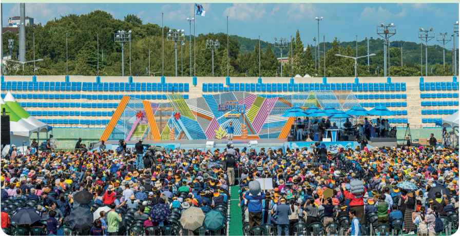
재밌는 사연과 흥겨운 무대, 8월 20일(일) 방송에서 확인하세요

시민들의 성원 속에 진행된 'KBS 전국노래자랑 군산시편'이 드디어 공개된다. 2013년 이후 10년만에 개최된 KBS 전국노래자랑 1차 예심에는 500여 명의 시민이 참가하며 뜨거운 열기를 보여줬다. 이 중 단 16개 팀만 본선에 진출해 월명종합경기장에서 열린 공개녹화에 참여했으며, 3000여 명의 시민들에게 끼와 흥이 넘치는 무대를 선보였다.