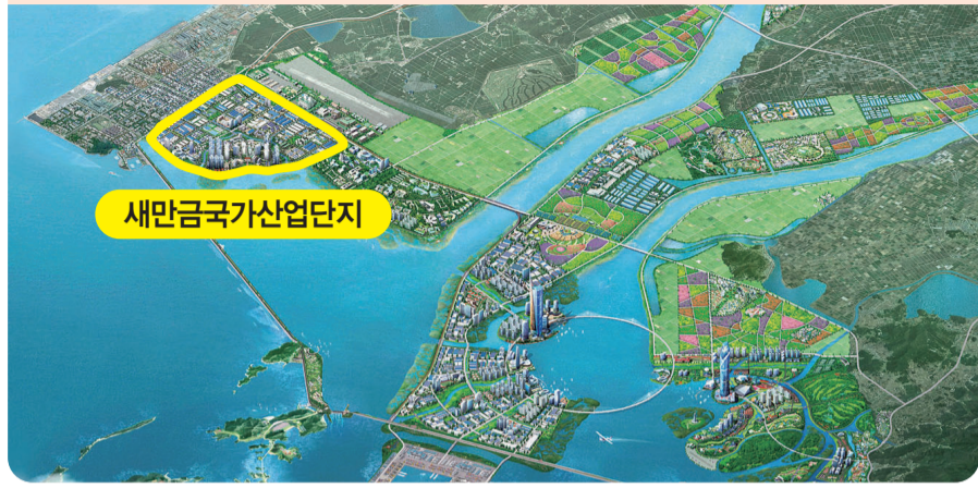
미래 먹거리 기업 집적화 가속