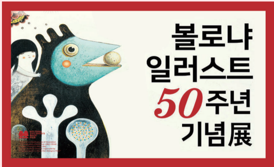
볼로냐 일러스트 50주년 기념전

어린이들에게는 무한한 상상력을 어른들에게는 잠시나마 동심으로 돌아갈 수 있게 해주는 마음이 행복한 전시. 아동문학계 노벨상이라 불리는 리가차상을 받은 작품을 한눈에 볼 수 있다.