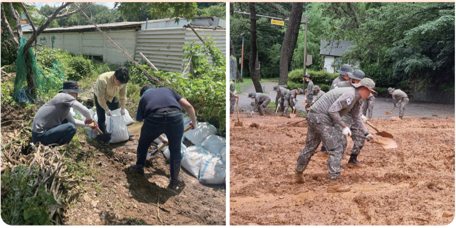
60년 만의 최고 강수량

군산시 기상 관측 이래 역대 최고 강수량을 기록한 집중호우로 지역 곳곳에 피해가 잇따르고 있다. (7.13~18. 기준)