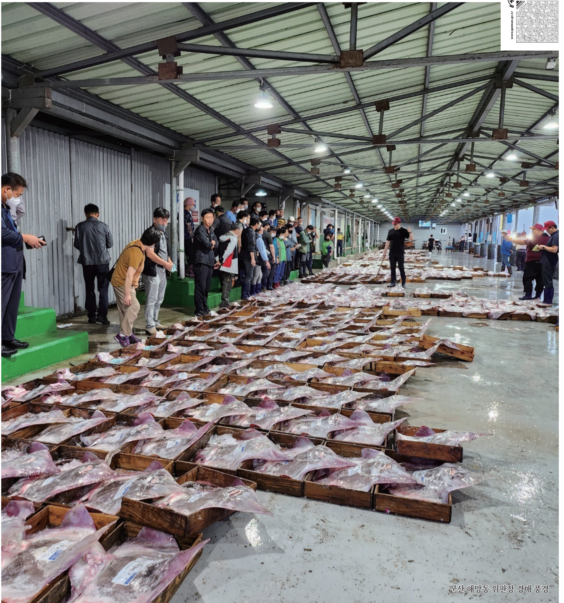
군산 해망동 위판장 경매 풍경