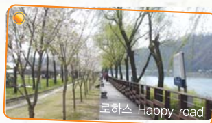
로하스 Happy road