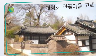
대청호 연꽃마을 고택