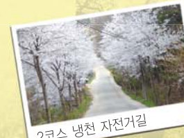
2코스 냉천 자전거길