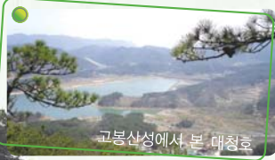
고봉산성에서 본 대청호

주변먹거리 : 고봉산농장, 샘골농장, 보금자리, 마로니에, 강나루, 촌골가든 등