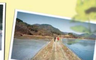
3코스 흥진~제방 자전거길