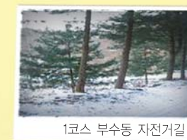
1코스 부수동 자전거길