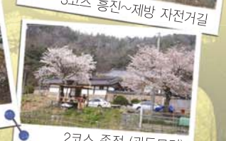
2코스 종점 (관동묘려)