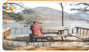
두메마을 산책길 데크

주변먹거리 : 두메마을(042-272-5802), 들꽃내(전통음식, 민박), 감나무골식당 등