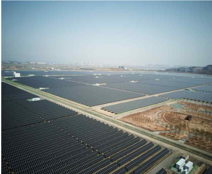
육상태양광 및 수상태양광 운영